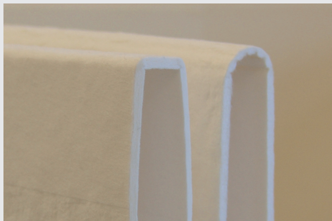
对折后的 FILTRODUR® 900背面.